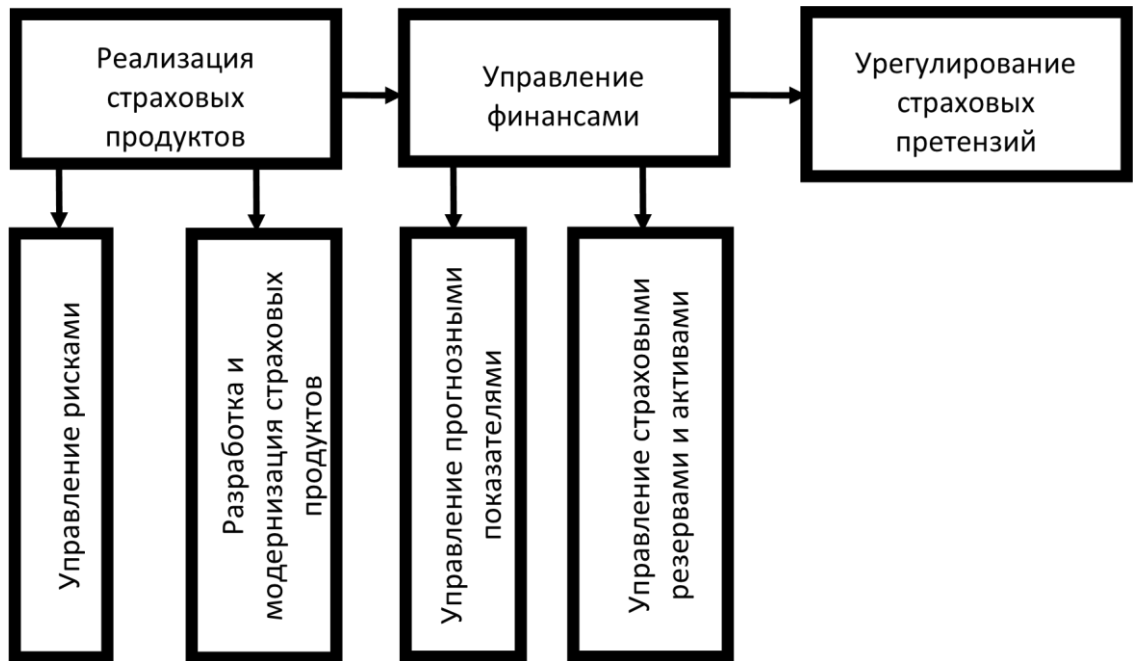
Рисунок 1. Бизнес-процессы Компании