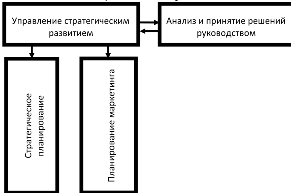
Рисунок 2. Процессы управления Компании